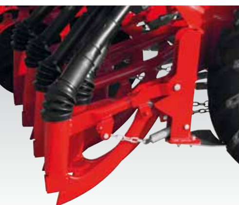
Assolcatore a falciatore sistema esclusivo MASCAR adatto su terreni sassosi e umidi MASCAR sole system of coulter suitable for stony and wet fields. MASCAR ausschließliches System von Schleppscharen, das die geeignete für steinige und nasse Böden ist. Redlica sierpowa, wyłączny system MASCARA, nadający się do terenów kamienistych i wilgotnych. Сошник в виде плужного резца, исключивная разработка MASCAR, подходит для влажных и каменистых почв.