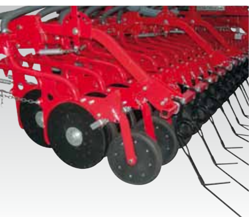
Assolcatrice a doppio disco con ruotino premi seme (opt) Double discs coulter with seed pressing wheel (opt) Doppelscheiben mit Tiefenführungsrollen (Opt) Redlica o podwójnym talerzu z kółkiem dociskowym (opcja) Сошник в виде двойного диска с прикатывающим колесиком (опц)