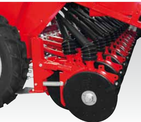
Assolcatore a disco doppio Double disc coulter Doppelscheibenschare Redlica z podwójnymi talerzami Сошник в виде двойного диска

Disponibile nelle versioni con assolcatori a scarpetta, falciatore e disco doppio.