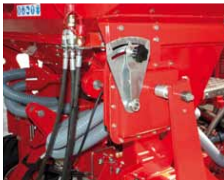
Variatore continuo a bagno d'olio (opt) Oil immersed gear box with continuous transmission (opt) Stufenloses Ölbad-G etriebe (Opt) Olejowa skrzynia bezstopniowa (opcja) Передача кулачковым валом с постоянным регулятором скорости (опц)