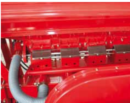
Dosatore seme Seed batcher Saatgutdosierer Dozownik ziarna Дозатор семени