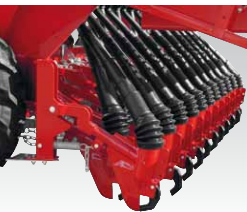
Assolcatore a scarpetta Suffolk coulter Stiefelschare Redlica stopkowa Сошник в виде плужка